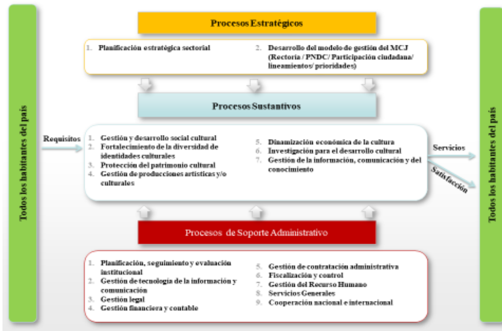
Mapa de Procesos Ver 13-03-2018

La versión que se presenta fue validada y aprobada por la Comisión Institucional de Procesos y Procedimientos del MCJ.