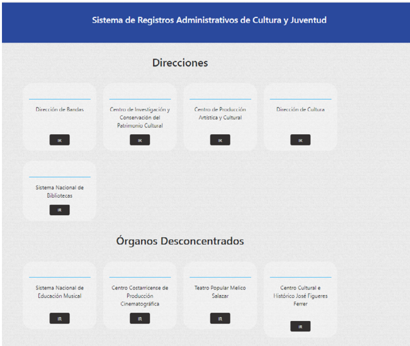
Figura 2 Organización de subsitios para cada institución en el SIRACUJ

Al ingresar a la plataforma, cada una de las instituciones que son parte del SIRACUJ tiene un espacio específico. En la siguiente figura se muestra la forma en que se organizan cada uno de estos subsitios: