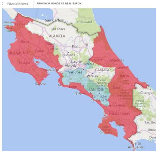
Mapa 1: Área geográfica alcanzada.

movimiento y presentaciones del espectáculo “Anansi, una odisea afro” para estudiantes y la comunidad, teniendo un alcance total de 24.801 personas beneficiadas.