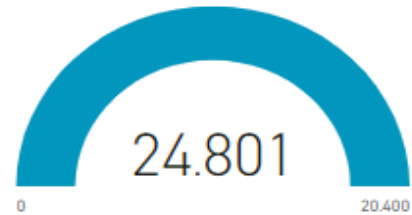
Gráfico Asistencia EuV I Semestre

Número de personas beneficiadas con las actividades culturales, artísticas y educativas realizadas en las regiones periféricas (20400)